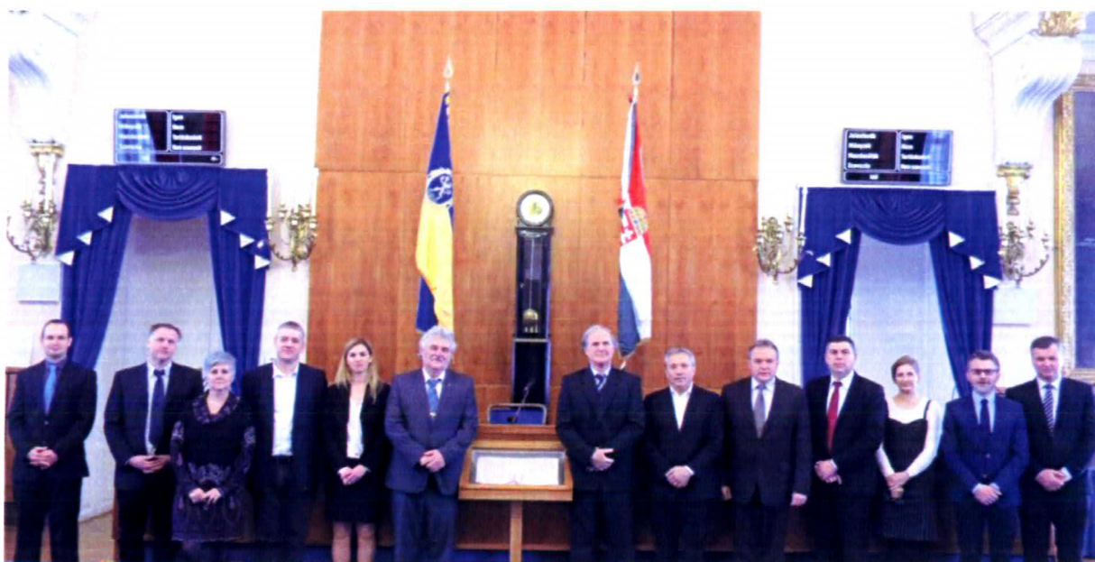
Zasadnutie Zhromaždenia a Dozernej rady 27.02.2017 v Budapešti