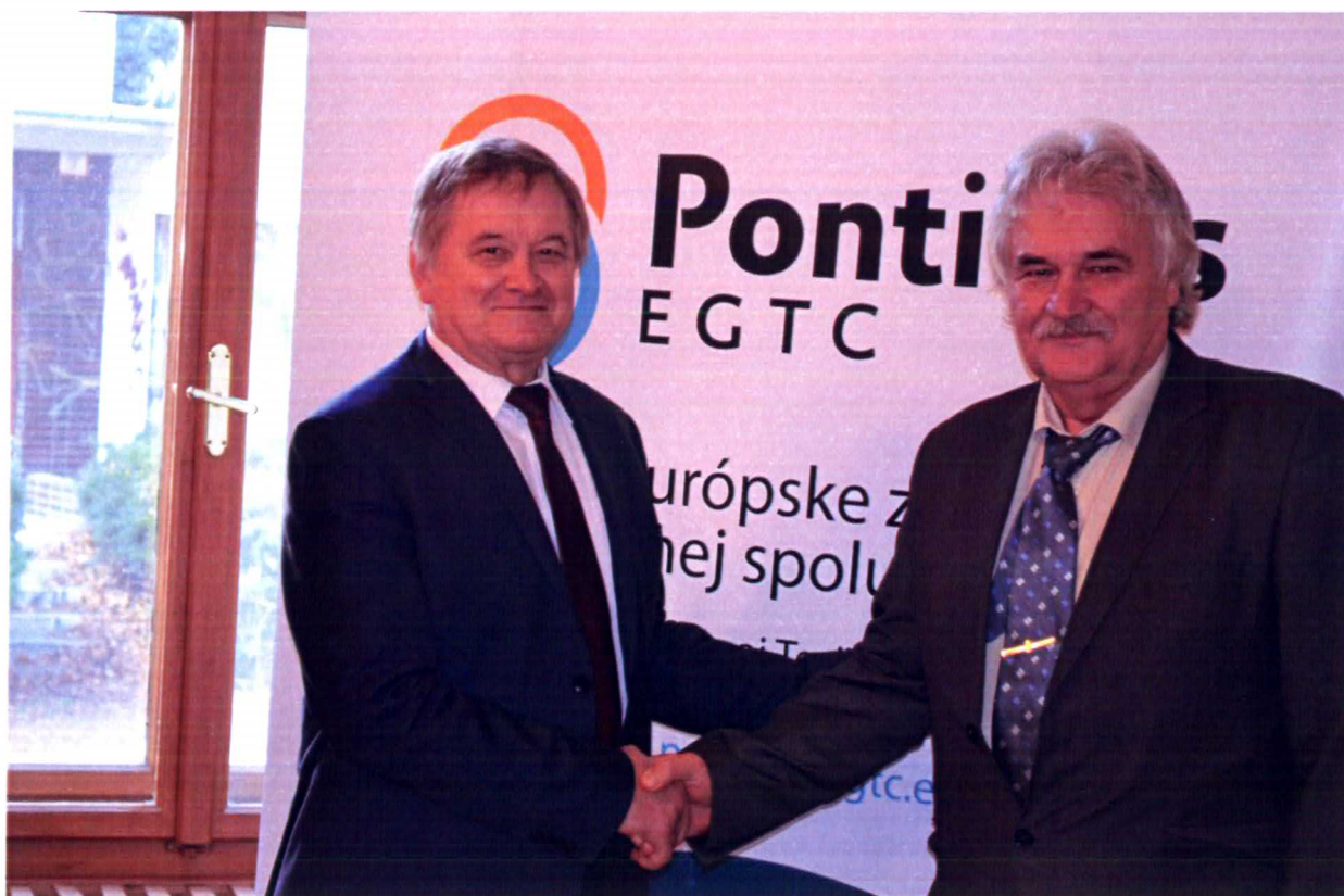
Zasadnutie Zhromaždenia 18.12.2017 v Nitre

Propagácia a medializácia EZÚS Pontibus bola zabezpečovaná prostredníctvom novo vytvorenej web stránky zoskupenia ( http://www.pontibusegtc.eu/ ) v dvojjazyčnej mutácii a mediálnych výstupoch v regionálnom mesačníku NSK Župné ozveny (marec 2017, máj 2017), v mesačníku Pest Megye Lapja (máj 2017). Ako nevyhnutná súčasť korporátnej identity bolo vytvorené vkusné logo Pontibus-u. Na zvýšenie povedomia verejnosti o zoskupení, boli vyrobené propagačné materiály a predmety s logom Pontibus (perá, trhacie bloky, obaly na písomnosti, roll-upy a USB kľúče).