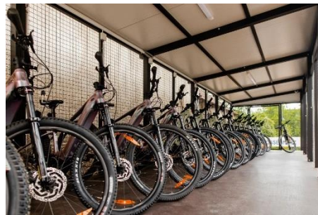
Ipolydamási oktatási központ

A projekt támogatásából a D.I.B. Nonprofit Kft. részéről 21 darab elektromos kerékpár került beszerzése, elsősorban az aktív időskori igények kielégítésére. A bérelhető kerékpárok tárolására egy biztonságos kerékpártároló is kialakításra került. Szintén az épület közelében kaptak helyet időskori edzések megtartására alkalmas kültéri edzőeszközök is.