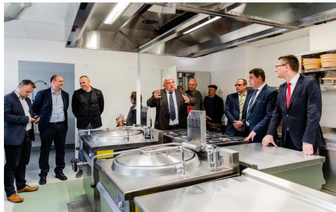
Bernecebaráti konyha átadása

A RE-START akcióterv másik projektje, a fentiekben ismertetett RE-STRUCTURE keretében valósultak meg azok az épületek, amelyekben a bernecebaráti konyha és a kemencei mosoda kialakításra került, így a két projekt erősen összefonódik. A RE-NEWAL keretén belül az említett szolgáltatások kialakításához szükséges eszközök beszerzése valósult meg.