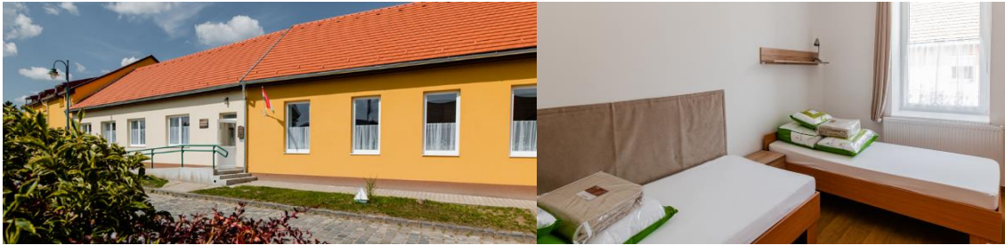
Szobi Védőszárny Időotthon

A Szobon létrejött Védőszárny Időotthon 32 idősnek biztosít megfelelő elhelyezést és gondozást. A mintegy 500 négyzetméteres épületben 1 darab négyágyas szoba, 6 darab háromágyas szoba és 5 darab kétágyas szoba került kialakításra, továbbá a szükséges eszközök is a projekt keretében kerültek beszerzésre. A fejlesztéssel 11 munkahely létesült a térségben. Szobon a már meglévő idősök otthona megmarad, így az új épülettel együtt 50 férőhellyel rendelkezik a település a bentlakásos ellátás iránti igények kiszolgálására. A projektrész teljes költsége (építés, eszközbeszerzések és egyéb kapcsolódó szolgáltatásokkal együtt) 872 160,38 EUR.