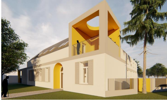
Ipolytölgyesi Ipoly-múzeum és víziturisztikai központ

turisztikai megalapozó tanulmányra és szakértői értékelésre alapozva – a szlovákiai Ipolyfödemesre egy erdei iskola és turistaszálló, míg Zalaba településen egy malomépület újrahasznosíthatóságának vázlatteveit készítettük el, míg a zselízi Sacher-ház tetőterének hasznosítására készítettünk engedélyezési terveket. Magyarországi oldalon Kóspallagon szintén egy malom-emlékhely rekonstrukciót, valamint egy közösségi, kulturális teret és kilátót terveztünk, Ipolytölgyesre pedig egy Ipoly-múzeum és víziturisztikai központ épületére készültek vázlattevek: