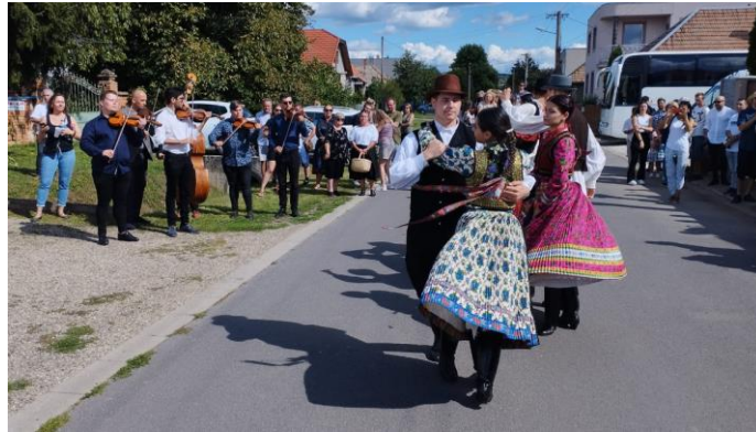
CSEMADOK rendezvények – Tudásátadás fiataloknak, hagyományőrzés