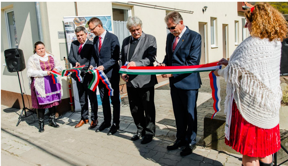
A kemencei mosodaépület átadása

A Kemencén létesítendő mosoda a térség szociális intézmények és idősotthonok és más intézmények mosodai feladatait segíti. A projekt keretében a mosodai eszközök beszerzése mellett szintén sor került egy szállításra alkalmas gépkocsi beszerzésére, amely a szennyes és tiszta ágyneműk és egyéb textíliák megfelelő helyre történő eljuttatását szolgálja majd.