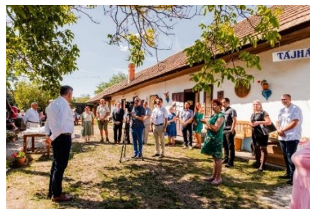
Alapkőletétel - beszéldek