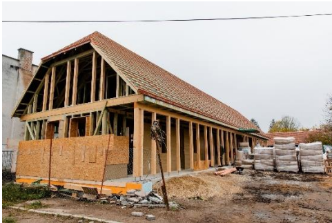
Az épülő kézművesház