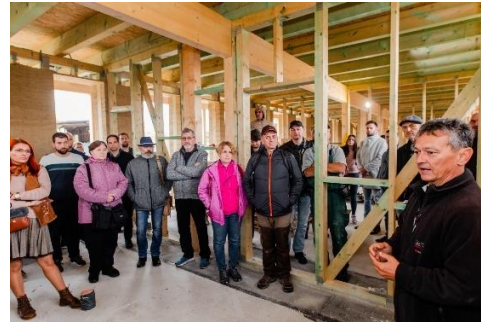
Kenderbeton építkezés – nyílt nap

A Tájház mintegy húszéves működése alatt több, mint tizenegyezer gyermeknek tartott táborokat, kézműves foglalkozásokat, így lassan kinőtték a meglévő épületet. Egyre nagyobb érdeklődés mutatkozik az ősi mesterségek iránt, ezért kézműves házzal bővítik a Tájházat, amely időskorúak rendezvényeinek is teret biztosít majd.