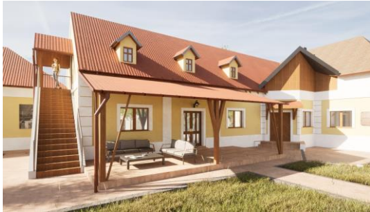
Sacher-ház (tetőtérbeépítés) Zselízen