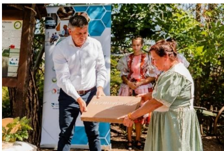
Alapkőletétel az ipolyszalkai tájházban

Az Ipoly Menti Kulturális és Turisztikai Társaság az ipolyszalkai Tájházat bővíti új, kézműves funkciókat tartalmazó épületrésszel.