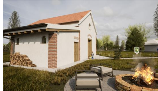
Malomépület újrahasznosítása Zalabán