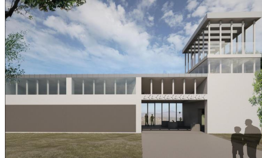
Közösségi és kulturális tér Kóspallagon