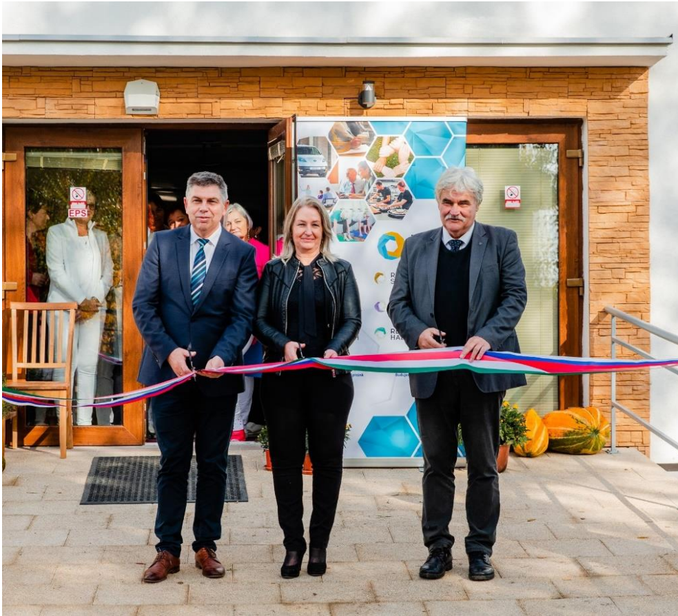
Az ipolyszalkai szociális intézmény átadása

A szobi idősek otthona fejlesztése terén jelenleg az eszközbeszerzések vannak folyamatban, amelyeket idáig finanszírozási lehetőségek hátráltattak, azonban várhatóan az IH részéről kiegészítő támogatás érkezik, és hamarosan megvalósul az intézmény megnyitása. A szükséges működési engedély már rendelkezésre áll.