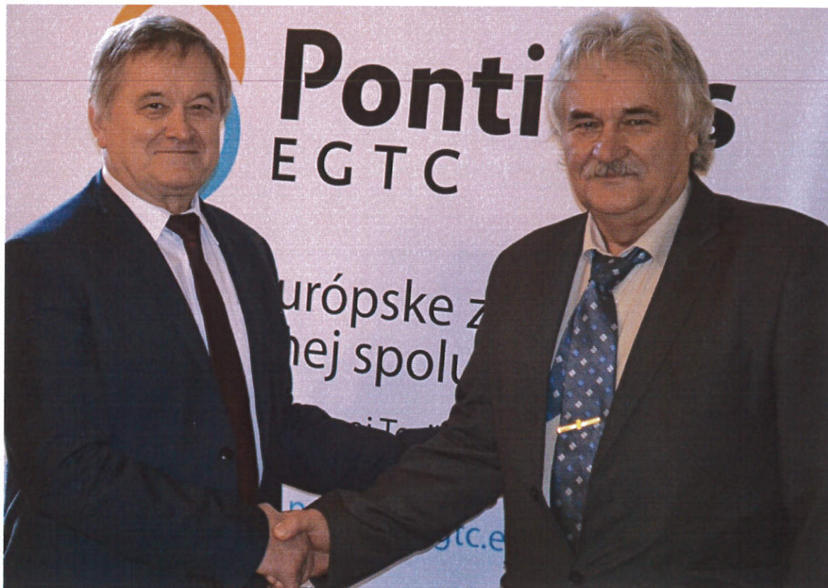
Közgyűlés 2017. december 18-án Nyitrán

A Pontibus ETT média felületen történő megjelenését és népszerűsítését az újonnan létrejött kétnyelvű honlap ( http://www.pontibusegtc.eu/ ), valamint a megyék regionális lapjaiban, - NKÖ területén Župné noviny c. havi lapban (2017. március és május) és a Pest Megye Lapjában (2017. május) – honlapján való megjelenések biztosítják. Az arculatépítés részeként megalkotásra került a Pontibus ETT logója, valamint a Társulás népszerűsítésére Pontibus logóval ellátva arculati elemek kerültek elkészíttetésre (tollak, mappák, pen-drivok, roll-upok, jegyzetfüzetek).